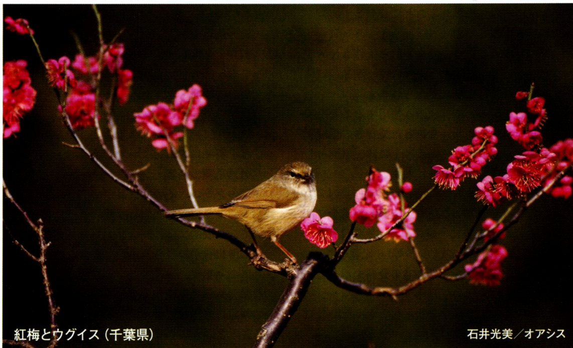
紅梅とウグイス(千葉県)